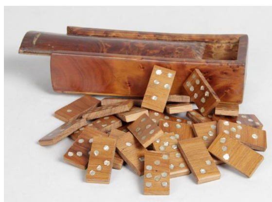
Jeu en bois et nacre